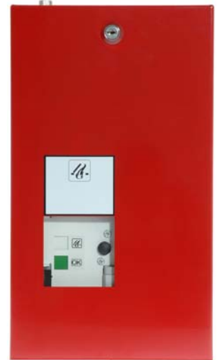
Alarmkasten für CO 2 -Einwegflaschen ohne Steigrohr