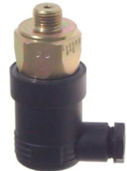
DS-W-230 mit Anschlussstecker