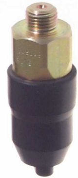
DS-S-42 mit Schutz- kappe